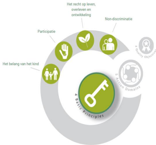
Figuur 1: Leidende principes