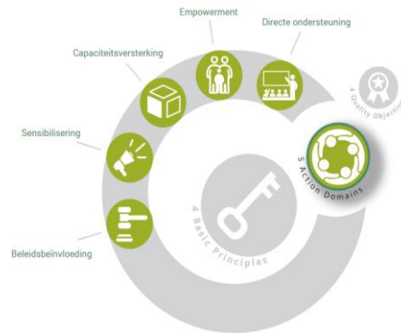
Figuur 2: Actiedomeinen